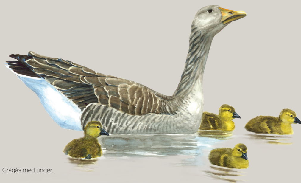
Grågås med unger.

I skoven rundt om mosens kan man være heldig at iagttage en besøgende havørn og musvågerne synes små i sammenligning. Ravnene skratter, når de parvis krydser Ølene.