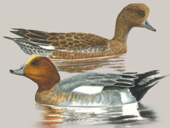
Pibeænder. Illustration: Jens Overgaard Christensen

De interessante områder i Præstø Fjord for fuglene er de lavvandede områder, hvor de kan søge føde. De findes fx. omkring øen Maderne. Præstø Fjord har en varieret bundvegetation, som hovedsagligt består af vandaks og havgræs, men også af kransnålalger, vandranunkel og vandpest. Der findes også en del ålegræsbelter i området.