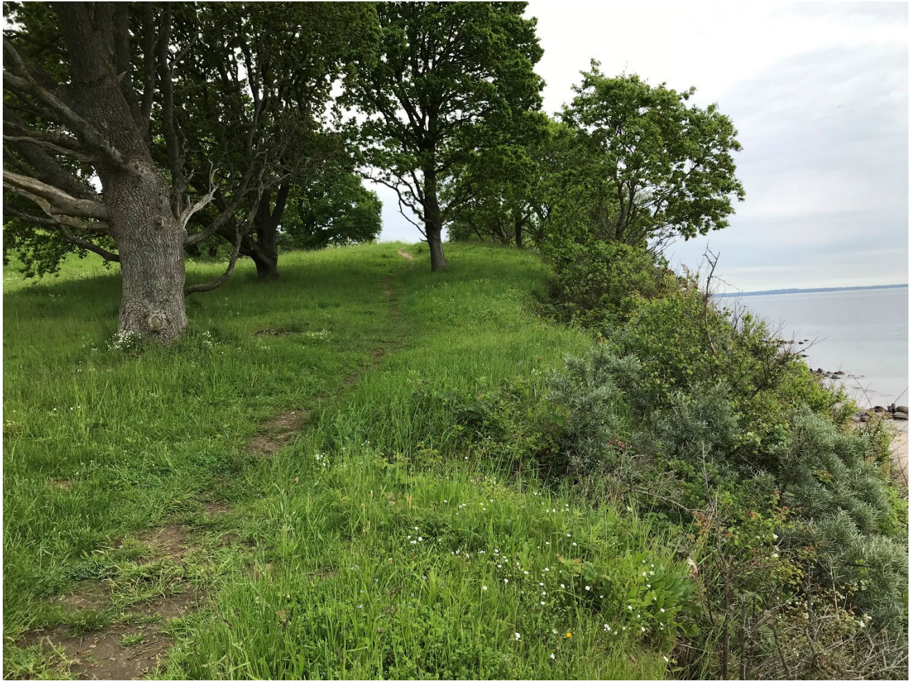
Foto fra kystskrænten og kalkoverdrev ved Strandmarken – ved Moesgaard.