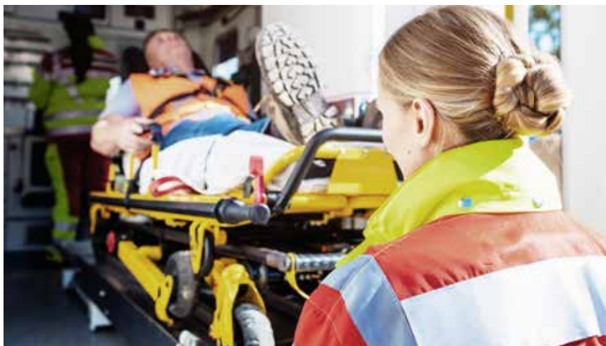
Der går heldigvis meget lang tid imellem at der er brug for en ambulance under jagt – lad os alle arbejde for, at det fortsætter sådan.