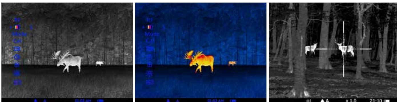
De to første foto er eksempler på lys i en termisk nathåndkikkert. Det sidste foto er igennem en natsigtekikkert.

Lysforstærkende sigtekikkerter eller lysforstærkende clip-on-systemer, som kan