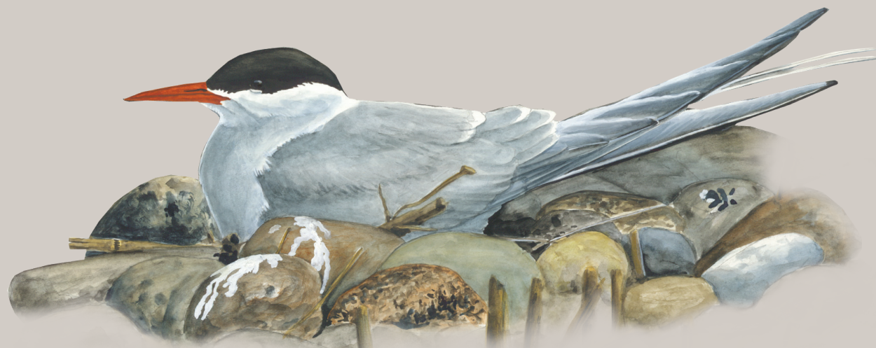
Havterne. Illustration: Jens Overgaard Christensen

Læs mere om Ramsar, Natura 2000 og vildtreservater på www.naturstyrelsen.dk