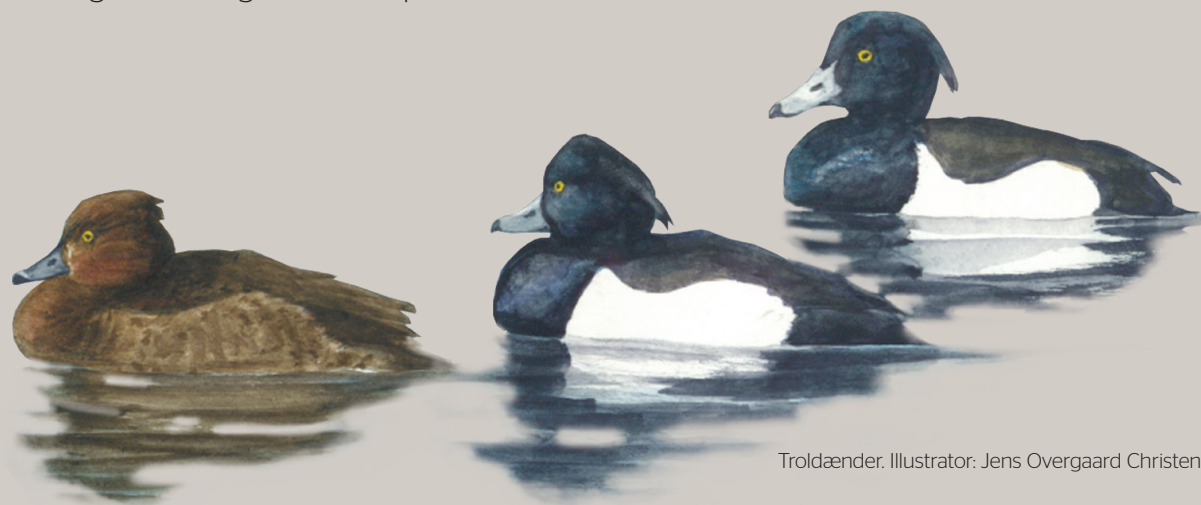
Trolldænder.

Jagt på svømme- og vadefugle er forbudt i hele reservatet.