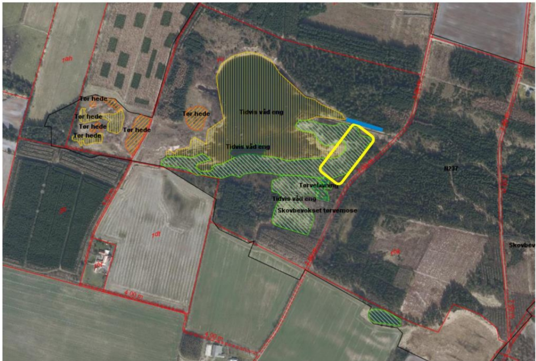
Kortbilag 3 viser Natura 2000 området, vest. Den sorte streg viser Natura 2000 grænsen.