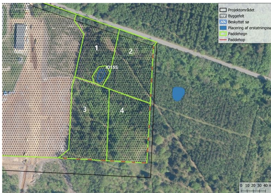
Figur 3 - Eksisterende sø samt skovbevoksede arealer beliggende indenfor byggefeltet, vil som følge af projektet blive nedlagt. Der planlægges indsamling af padder omkring sø ID15S samt i de fire skovbevoksede kvadrater, 1-4. Mod øst og syd etableres paddehop, der sikrer, at padder af sig selv kan vandre ud af området, mens paddehegnet forhindrer nye individer i at vandre ind.

Da paddehegnet opsættes i paddernes dvaleperiode (november til februar) og da markarealer i omdrift samt læhegn indenfor byggefeltet vurderes ikke at udgøre rasteområde for padder, så vurderes der ikke at være forekomst af padder i tilknytning til øvrige arealer indenfor det planlagte paddehegn.