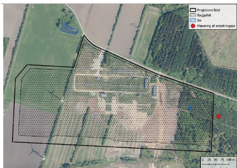
Figur 2 - Planlagt placering af erstatningssoen og placering af erstatningshabitat mod vest.

Baggrunden for projektet er at fremtidssikre højspændingsstationen, da den ligger som et strategisk knudepunkt i det overordnede elnet. Udvidelsen er bl.a. nødvendig for at imødekomme yderligere forbrug og vedvarende energiproduktion i området. Udvidelsen giver mulighed for at tilslutte flere vedvarende energianlæg (VE-anlæg), som fx solcelleanlæg og landvindmøller foruden en tilslutning af en kommende havvindmøllepark i Nordsøen. Derudover øger det muligheden for etablering af anlæg, hvor strøm udnyttes til at fremstille f.eks. brint (Power-to-X-anlæg).