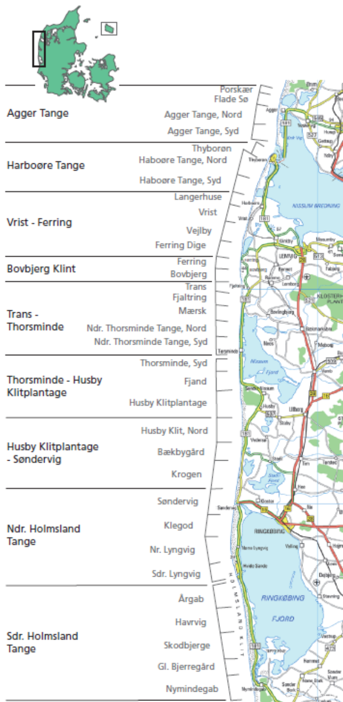
Figur 1. Oversigtskort over kyststrækningen fra Lodbjerg til Nymindegab