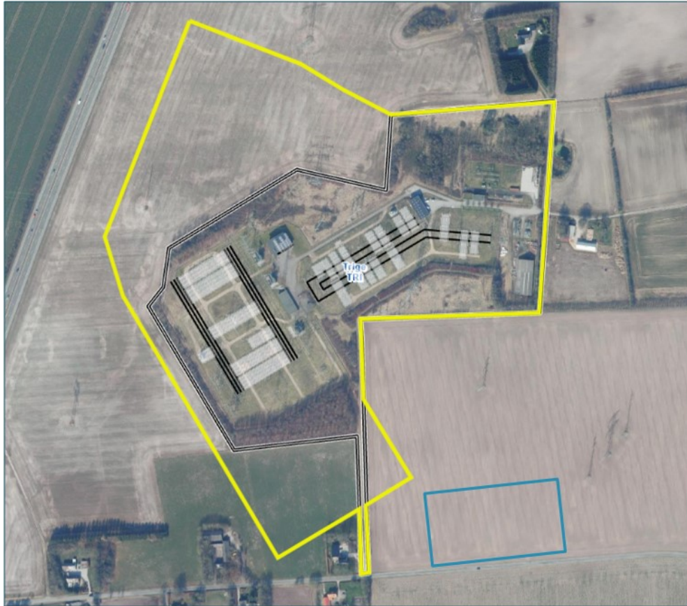
Figur 2-1. Det forventede fremtidige arealbehov for Højspændingsstation Trige er vist med gult. Eksisterende samleskinne og felter er vist med sort og grå. Nuværende stationsafgrænsning er vist med sort dobbeltstreg. Midlertidig byggeplads er vist med blå.

Med projektet foretages der terrænregulering, etableres regnvandshåndtering og foretages klimasikring af stationsudvidelsen. Håndtering af vand på stationsområdet vil ske ved brug af LAR-løsninger med forsinkelse i grøfter og/eller bassiner.