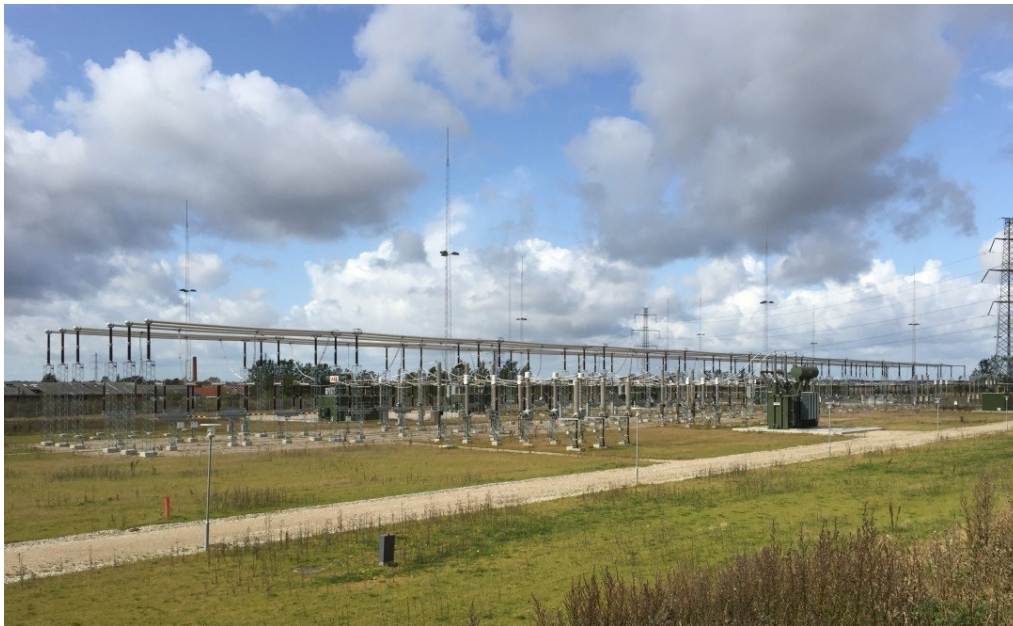
Figur 3. Foto med eksempel på friluftstation (AIS).

Der vil forud for anlægsarbejdet foretages arkæologiske forundersøgelser og evt. udgravninger i udvidelsesområdet.