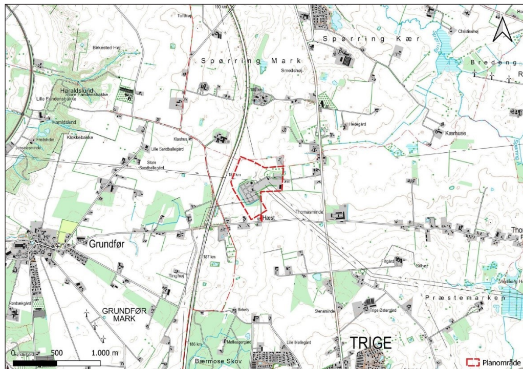
Figur 2. Projektområdet for Højspændingsstation Trige med udvidelse.

I kanten af projektområdet vil der blive etableret ny afskærmende beplantning baseret på en nærmere beplantningsplan, mens dele af den eksisterende beplantning skal fjernes for at give plads til stationsanlæg.