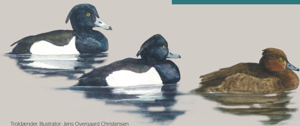
Troldænder. Illustration: Jens Overgaard Christensen

Læs mere om Ramsar, Natura 2000 og vildtreservater på www.naturstyrelsen.dk