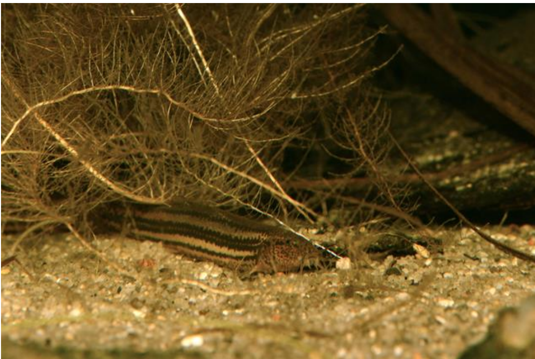
Dyndsmerling yngler i området (Foto Biopix.dk, WWW.biopix.dk).

Dette Natura 2000-område er specielt udpeget på grundlag af en væsentlig tilstedeværelse af følgende naturtyper og arter: nedbrudt højmose (7120), hængesæk (7140), skovbevokset tørvemose (91D0) og dyndsmerling. Natura 2000-planens målsætninger og indsatsprogram er væsentlige elementer i beskyttelsen af disse og af en generel sikring og forbedring af området naturværdier.