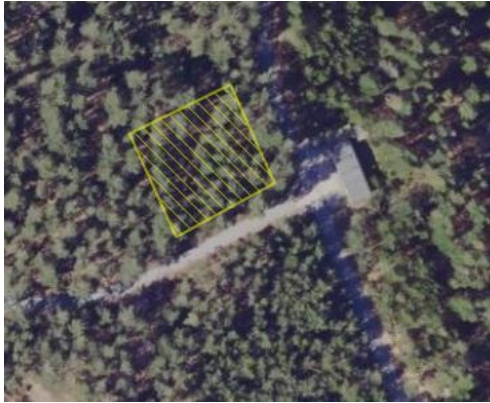
Kort 2: Udklip af kort 1, Gul skravering viser areal som ryddes. Hele området er omfattet af fredskovspligt. Ortofoto forår 2023.