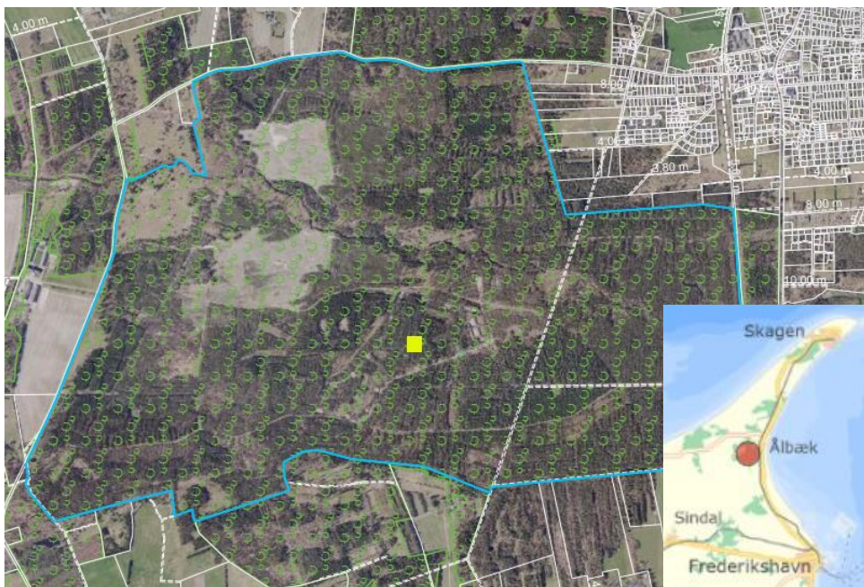
Kort 1: Oversigtskort. Placering af projektområde er vist med gul firkant, matr. nr. 2l Gårdbo, Råbjerg er fremhævet med blå linje. Fredskovspligtige arealer er vist med grøn træsignatur, ortofoto forår 2023.

Miljøstyrelsen giver hermed dispensation efter skovloven til rydning af fredskov og opførelse af driftsbygning på matr. nr. 2l Gårdbo, Råbjerg, som ligger i Frederikshavn Kommune. Projektet vedrører 0,5 ha fredskovspligtigt areal. Projektets placering og omfang fremgår af kort 1 og 2.