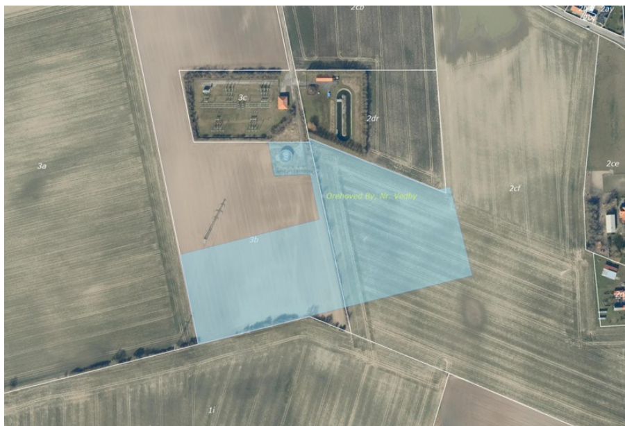
Figur 4: Placeringen af den nye station ved Orehoved (vist med blå) og adgangsvejen der etableres i forlængelse af den eksisterende vej.

Projektet bygger en ny højspændingsstation syd for den eksisterende station (som fjernes). Stationsområdet udgøres i dag af opdyrkede marker og er beliggende i landzone udenfor eksisterende lokalplaner. Lokalplan for stationen vedtages i november 2023. Stationen indeholder bl.a. en transformer, kompenseringspole med tilhørende samleskinne og højspændingsfelter, og der anlægges et regnvandsbassin eller bede på arealet. Nedsivning af overfladevand sker med mulighed for overløb til et rørlagt vandløb ved en 10-års hændelse. Der opføres 12 stk. 25,5 m høje lynfangsmaster på stationen. Der opføres desuden en manøvrebygning, og stationsarealet omkranses af et beplantningsbælte. Stationen inkluderer også etablering af mere kørevej langs den nuværende adgangsvej og videre fra muffehus til stationen. Arealet for den nye 132 kV station er ca. 34.100 m 2 (110 x 310 m).