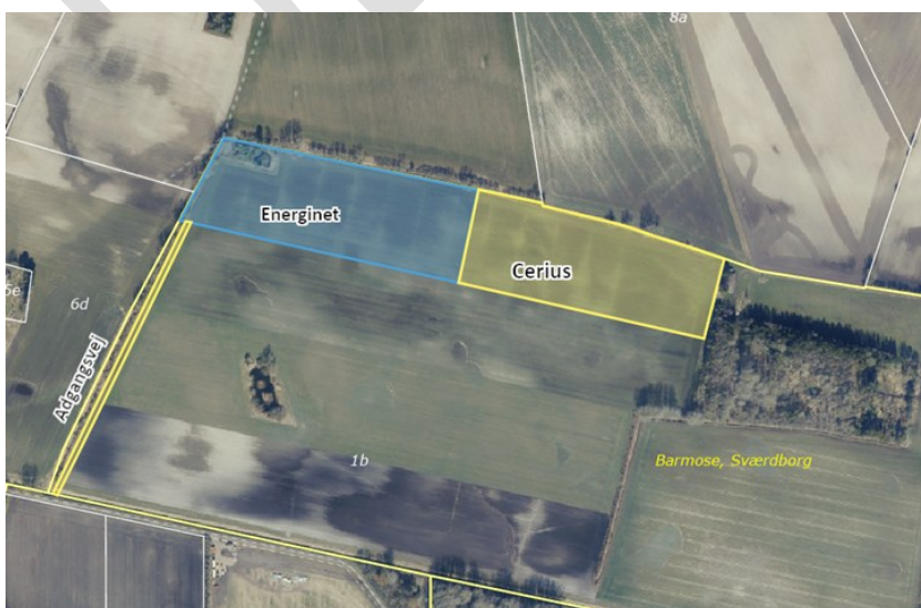
Figur 3: Placeringen af den nye station ved Vordingborg Nord.

Projektet bygger en ny højspændingsstation med en transformer, en kompenseringsspole og tilhørende samleskinne og højspændingsfelter. Stationsområdet udgøres i dag af opdyrkede marker og er beliggende i landzone udenfor eksisterende lokalplaner. Lokalplan for stationen vedtages i oktober 2023. Der opsættes op til 12 stk. 25,5 m høje lynfangsmaster på stationen. Der opføres desuden en manøvrebygning og et nedslivningsbassin til regnvand, og stationsarealet omkranses af et beplantningsbælte. Regnvand vil via eksisterende dræn blive afledt til Næs Å (09809). Arealet for den nye 132 kV station er ca. 33.000 m 2 (150 x 330 m).