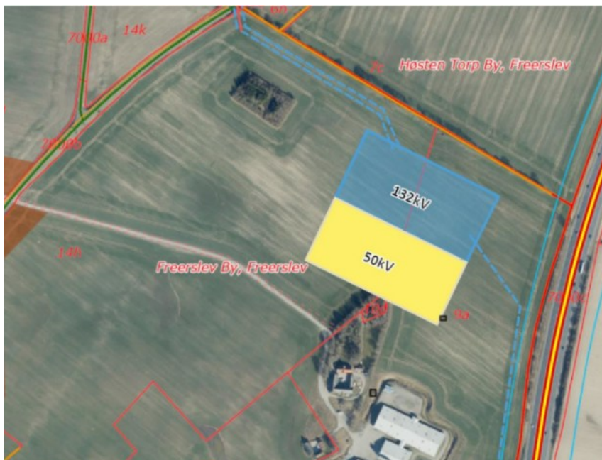
Figur 2: Areal til ny station Haslev Øst. Den blå flade viser Energinets nye stationsareal. Den gule flade er areal til station for det lokale netselskab Andel Holding.

Anlægsarbejderne for etablering af nye stationer vil som udgangspunkt blive udført inden for normal arbejdstid, som på hverdage er kl. 07-18 og lørdag 07-14. Arbejderne ved stationerne vurderes at medføre ca. 500 sættevogne pr. station over en periode på seks uger. Arbejdstid uden for dette aftales med den kommunale myndighed. Der forekommer ikke støjende arbejder som f.eks. pælefundering eller spunsramning.