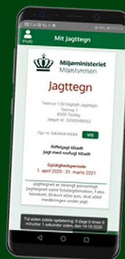
Antal brugere af Digitalt Jagttegn