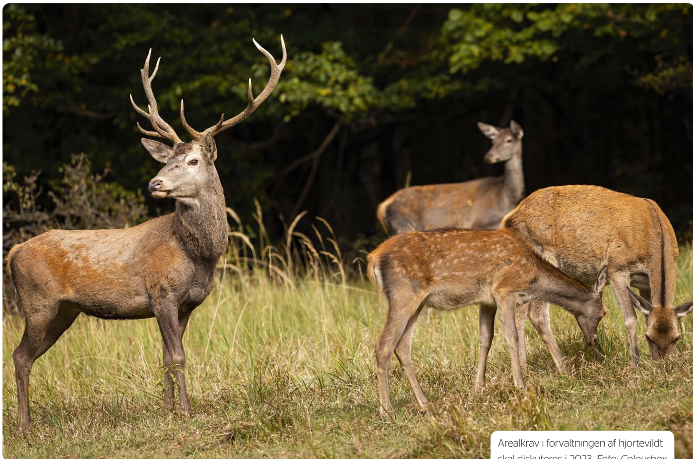
Arealkrav i forvaltningen af hjortevildt skal diskuteres i 2023.