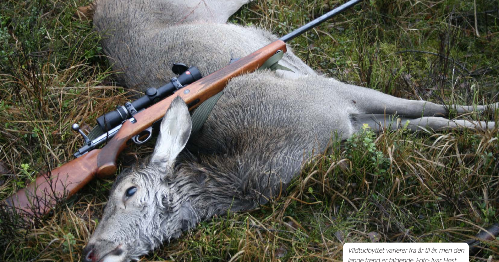
Vildtudbyttet varierer fra år til år, men den lange trend er faldende.