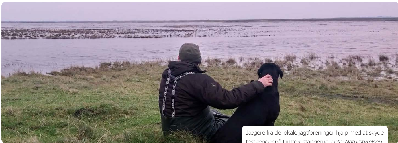
Jægere fra de lokale jagtforeninger hjalp med at skyde test-ænder på Limfjordstangerne.