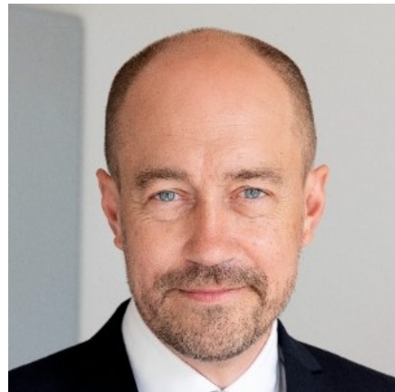
Miljøminister Magnus Heunicke

Natura 2000-områder rummer nogle af Europas og Danmarks største og mest værdifulde naturområder og repræsenterer en stor del af biodiversiteten. De danske Natura 2000-områder bidrager til det fælles EU-mål om 30 pct. beskyttet natur på land og til havs.