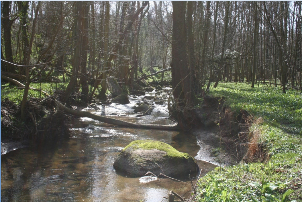
Gyldenså i april.

Natura-2000-området ligger på Østbornholm på kysten mellem Bølshavn og Listed. Området er 13,6 ha stort, strækker sig over ca. 1,4 km og går mellem Svanekevej og Bølshavn, hvor det har kontakt med kysten.