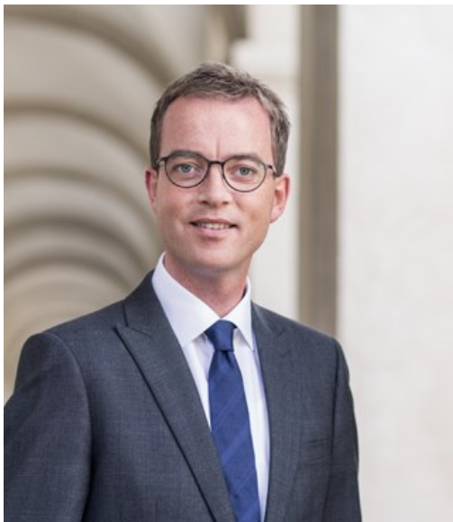
Miljø- og Fødevareminister Esben Lunde Larsen

De 252 Natura 2000-områder indeholder nogle af Danmarks største og mest værdifulde naturområder. De ligger fordelt i hele landet fra nord til syd og øst til vest og repræsenterer en stor del af den danske biodiversitet. Hvert område har en plan, og nu offentliggøres Natura 2000-planerne for 2016-21.