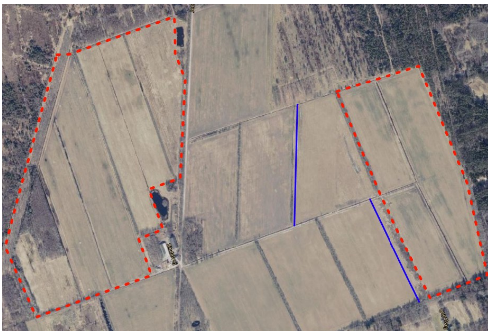
Nye grøfter vist med blå streg.

For at sikre afløbet og vandstanden i beskyttet sø etableres der et nyt rørfløb og grøft nedstrøms oprensning for at sikre afledningen.