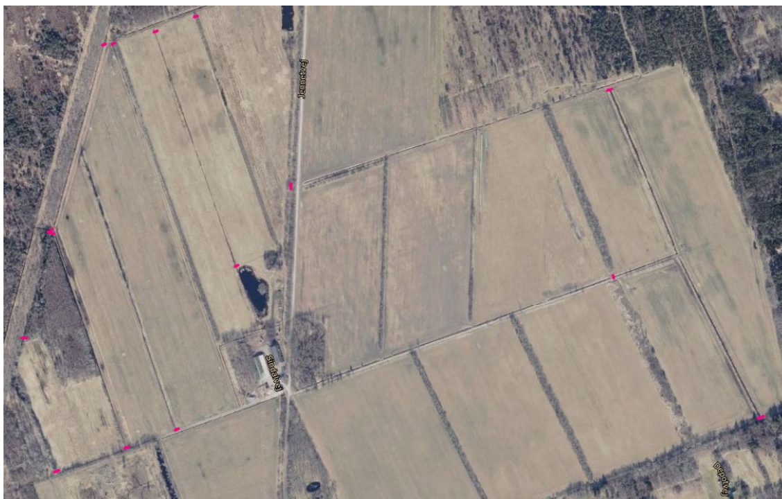
Træspurs vist med lilla streg.

Der etableres overgange til kronstyr da de på de steder, hvor de passerer grøfterne ødelægger brinkerne.