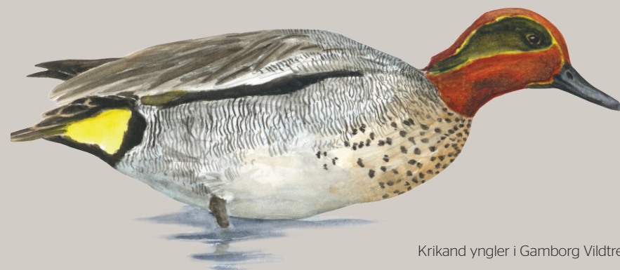
Krikand yngler i Gamborg Vildtreservat

Danmark er et vigtigt knudepunkt på trækvejene for millioner af svaner, gæs, ænder og vadefugle. For at yde vandfuglene beskyttelse imod jagt og anden forstyrrelse under deres ophold i Danmark er der etableret et netværk af natur- og vildtreservater. Her har fuglene fred til at raste og søge føde. En række reservater sikrer herudover fugle og sæler fred i yngletiden.