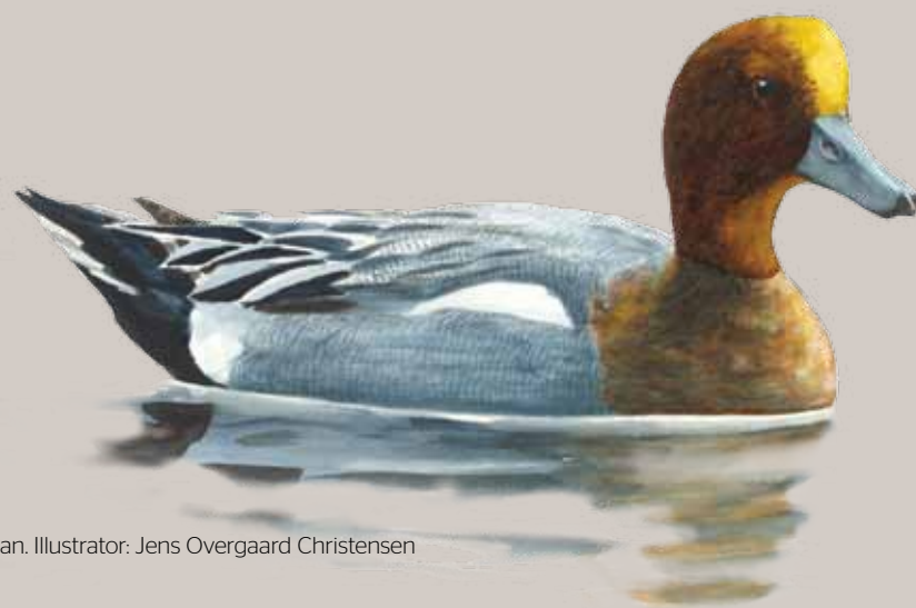
Pibeand, han. Illustration: Jens Overgaard Christensen

Landskabet omkring Fanefjord-Grønsund består af kyster med strandenge, rørsumpe og lavvandede vige. Farvandene er gode biotoper for ålegræs, og på mere stenede dele af bunden trives en rig rødalgeflora. Den mest markante del af reservatet består af selve Fanefjord med den lille ø Malurtholm.