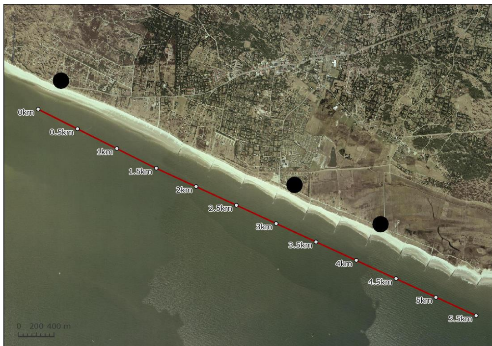
Figur 2. Placering for den omtrentlige placering af de midlertidige arbejdspladser er markeret med sort.

Ved aktiviteter på land vil der være behov for to mindre arbejdspladser så tæt som muligt på arbejdsområdet. Kystdirektoratet, Kystbeskyttelse – Drift og anlæg vil på forhånd anvise, at arbejdspladsen etableres på enten den offentlige parkeringsplads ved Ishuset eller på parkeringspladserne ved hofde 4 eller 7, jf. Figur 2.