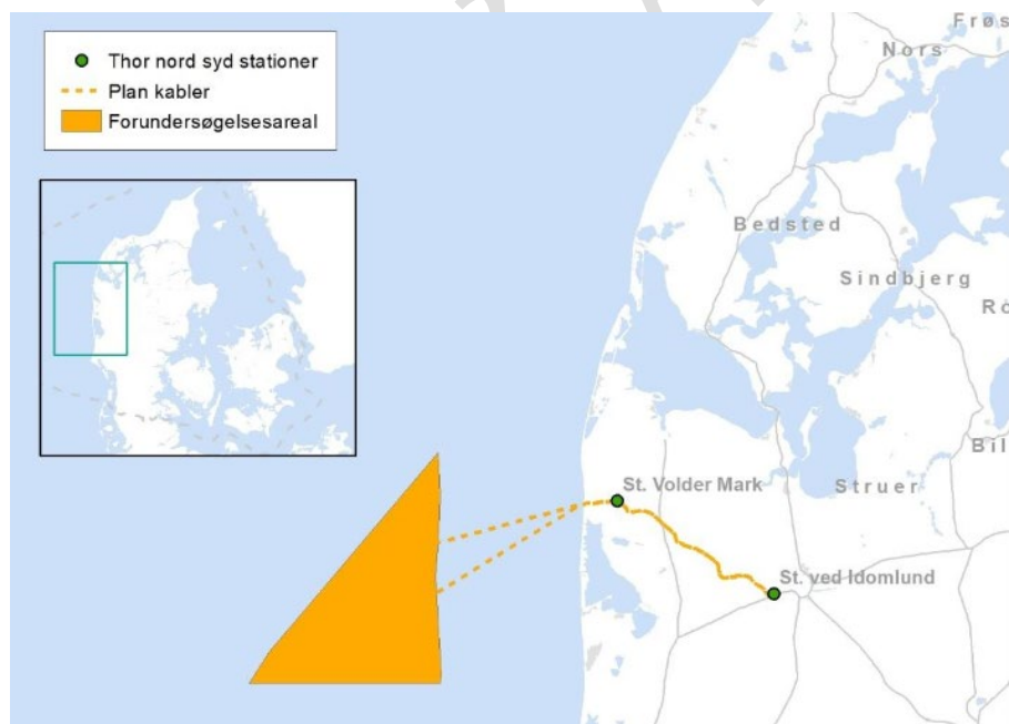
Figur 1. Skitse over forundersøgelsesområde til Thor Havvindmøllepark, og korridor for kabelruter og højspændingsstationer ved Volder Mark og Idomlund. Signaturen "Thor nord syd stationer" angiver de to højspændingsstationer.

Byggeriet af landanlægget skal igangsættes i 2022 for at være klar til at modtage havmøllestrøm, når de første møller i det offshore anlæg er opført 2025. Havvindmølleparken skal stå helt færdig ved udgangen af 2027.